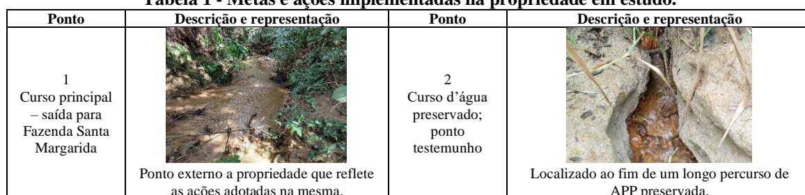
Tabela 1 - Metas e ações implementadas na propriedade em estudo.

A Tabela 1 apresenta a caracterização das ações implementadas na propriedade estudada no âmbito do PSA-Água. De maneira geral, as ações foram implementadas no sentido de recuperação de APP e de controle da ocorrência de processos erosivos por meio de práticas conservacionistas, bem como medidas de melhoria no descarte do esgoto doméstico.